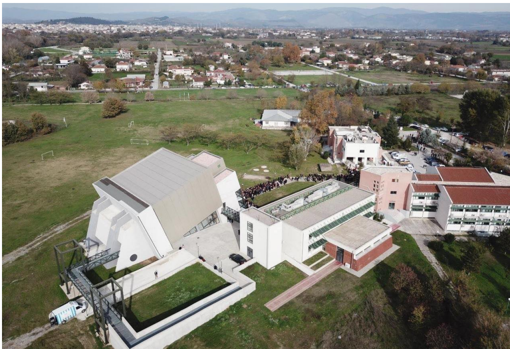
Φωτογραφία των εγκαταστάσεων και χώρων του ΤΕΦΑΑ.