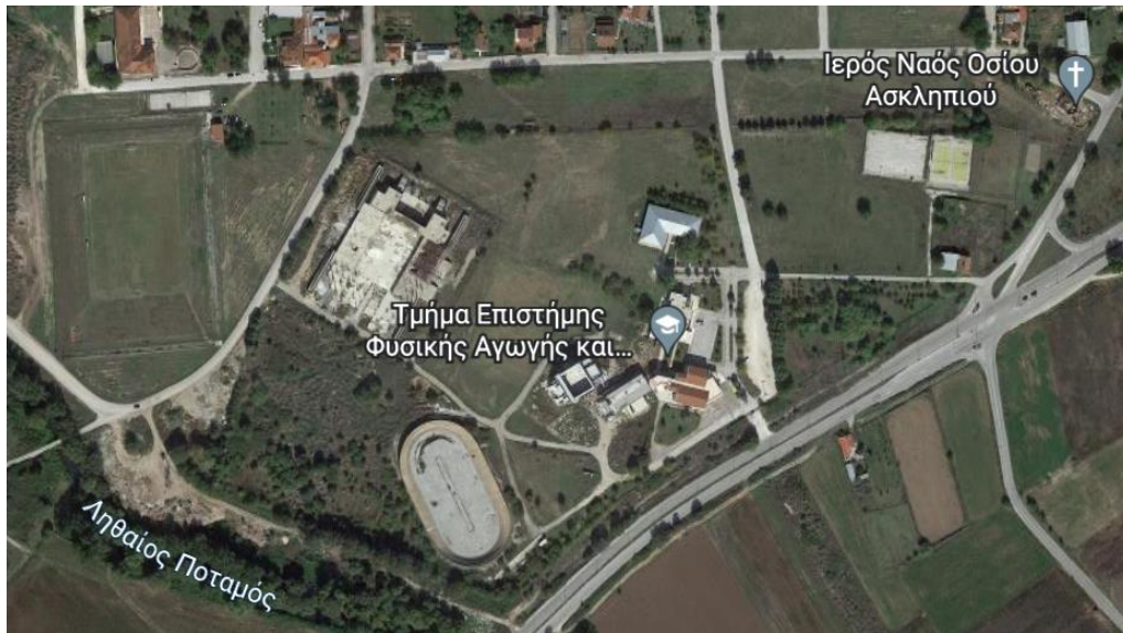
Φωτογραφία κάτοψης των οικοπέδων και χώρων του ΤΕΦΑΑ.

Τμήμα Διαιτολογίας και Διατροφολογίας στο βόρειο τμήμα της πόλης, στεγαζόμενο σε ένα κτίριο 3.000 τ.μ. ενώ, παράλληλα, χρησιμοποιεί και χώρους, όπως το αμφιθέατρο του ΤΕΦΑΑ στην περιοχή των Καρυών.