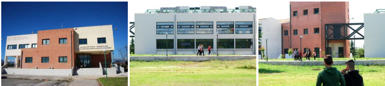
Μέρος των εγκαταστάσεων του ΤΕΦΑΑ.