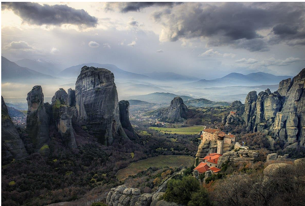
Τα Μετέωρα με το μοναστικό συγκρότημά τους.

Τα Τρίκαλα βρίσκονται 20 χιλιόμετρα μακριά από τα Μετέωρα, ένα σύμπλεγμα από βράχους από ψαμμίτη έξω από την πόλη της Καλαμπάκας. Τα μοναστήρια των Μετεώρων, που είναι χτισμένα στις κορυφές κάποιων από τους βράχους αποτελούν το δεύτερο πιο σημαντικό μοναστικό συγκρότημα στην Ελλάδα μετά το Άγιον Όρος και από το 1988 περιλαμβάνονται στον κατάλογο μνημείων παγκόσμιας κληρονομιάς της UNESCO.