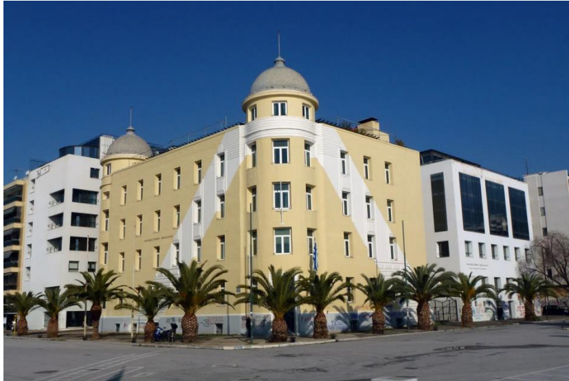
Κτίριο Πρυτανείας – Διοικητικών υπηρεσιών του Πανεπιστημίου Θεσσαλίας στο Βόλο (Κτίριο Παπαστρατού)

Το Πανεπιστήμιο Θεσσαλίας (ΠΘ) ( https://www.uth.gr/ ) ιδρύθηκε το 1984 και δέχτηκε τους/τις πρώτους/ες φοιτητές/ριες του το ακαδημαϊκό έτος 1988-89. Με διοικητική έδρα την πόλη του Βόλου, έχει αναπτυχθεί σε όλη την Περιφέρεια Θεσσαλίας (Βόλο, Λάρισα, Καρδίτσα και Τρίκαλα) και σε τμήμα της Στερεάς Ελλάδας (Λαμία).