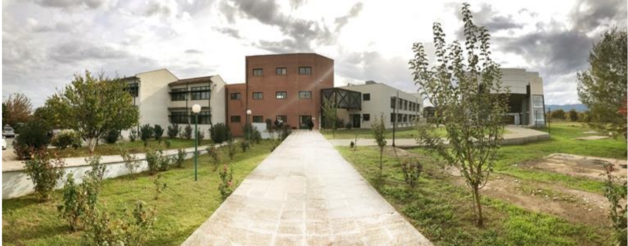
Μέρος των εγκαταστάσεων του ΤΕΦΑΑ.