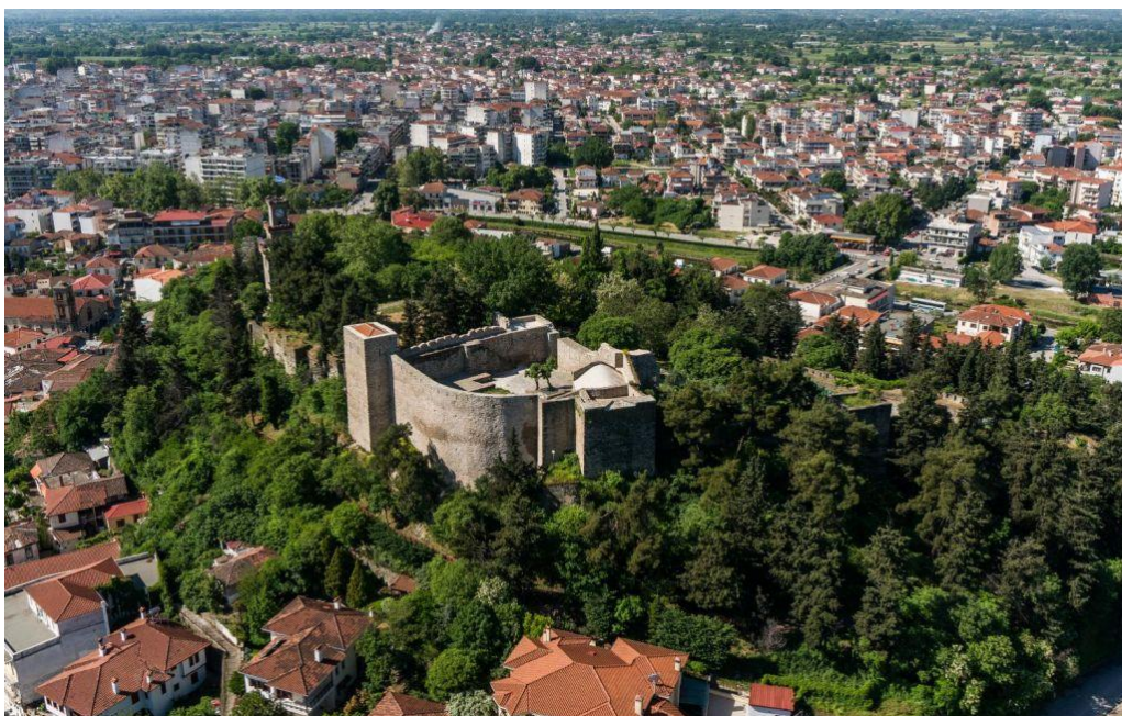
Το φρούριο των Τρικάλων.

Στην βορειοανατολική πλευρά της πόλης των Τρικάλων δεσπόζει το μεσαιωνικό κάστρο, το οποίο χτίστηκε από τον Βυζαντινό Αυτοκράτορα Ιουστινιανό τον 6 ο αιώνα μ.Χ. στα ερείπια της ακρόπολης της αρχαίας Τρίκκης. Στους πρόποδες του απλώνεται η παλιά πόλη αποτελούμενη από τις συνοικίες Βαρούσι και Μανάβικα. Η πρώτη διακρίνεται για τα παλιά αρχοντικά, κατασκευασμένα μεταξύ 17 ου και 19 ου αιώνα και τα στενά σοκάκια της. Στη δεύτερη βρίσκονται πολλά εστιατόρια και ταβέρνες που αποτελούν πόλο έλξης για τους επισκέπτες.