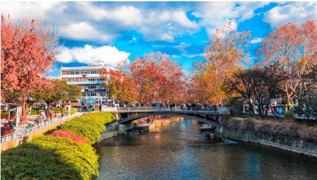
Ο ποταμός Ληθαίος με την κεντρική πεζογέφυρα.

Τα Τρίκαλα είναι πόλη της Δυτικής Θεσσαλίας και αποτελούν την πρωτεύουσα της Περιφερειακής Ενότητας Τρικάλων. Η ευρύτερη περιοχή των Τρικάλων κατοικείται από τους προϊστορικούς χρόνους και οι πρώτες ενδείξεις ζωής στο σπήλαιο της Θεόπετρας φτάνουν ως το 49.000 π.Χ. περίπου. Έχουν επίσης ανακαλυφθεί νεολιθικοί οικισμοί από το 6.000 π.Χ. στο Μεγάλο Κεφαλόβρυσο και άλλες τοποθεσίες. Η πόλη των Τρικάλων είναι χτισμένη πάνω στην αρχαία πόλη Τρίκκα ή Τρίκκη, η οποία ιδρύθηκε γύρω στην 3η χιλιετία π.Χ. και ονομάστηκε έτσι από τη νύμφη Τρίκκη, κόρη του Πηνειού ή κατ' άλλους του Ασωπού ποταμού. Η πόλη ήταν σημαντικό κέντρο της αρχαιότητας, καθώς εδώ έζησε και έδρασε ο Ασκληπιός, που σήμερα αποτελεί έμβλημα του Δήμου Τρικκαίων.