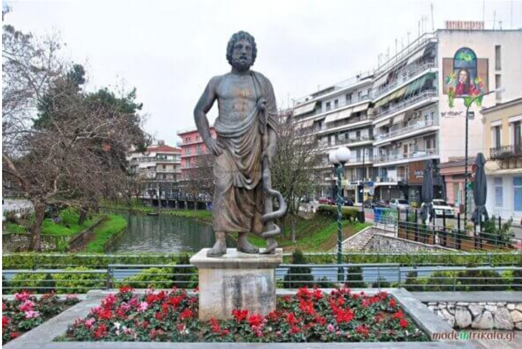
Το άγαλμα του Ασκληπιού, του Θεού της Ιατρικής, σε κεντρικό σημείο της πόλης.

Στην βορειοανατολική πλευρά της πόλης των Τρικάλων δεσπόζει το μεσαιωνικό κάστρο, το οποίο χτίστηκε από τον Βυζαντινό Αυτοκράτορα Ιουστινιανό τον 6 ο αιώνα μ.Χ. στα ερείπια της ακρόπολης της αρχαίας Τρίκκης. Στους πρόποδες του απλώνεται η παλιά πόλη αποτελούμενη από τις συνοικίες Βαρούσι και Μανάβικα. Η πρώτη διακρίνεται για τα παλιά αρχοντικά, κατασκευασμένα μεταξύ 17 ου και 19 ου αιώνα και τα στενά σοκάκια της. Στη δεύτερη βρίσκονται πολλά εστιατόρια και ταβέρνες που αποτελούν πόλο έλξης για τους επισκέπτες.