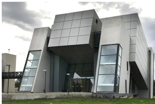
Το αμφιθέατρο του ΤΕΦΑΑ.